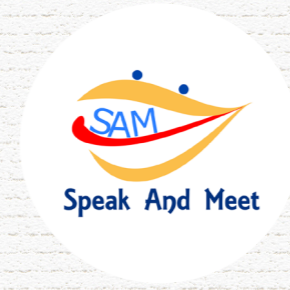
SPEAK AND MEET Lille