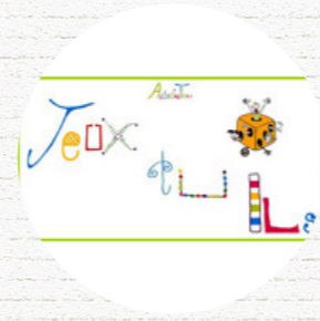
JEUX TU ILS Hergnies