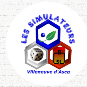
LES SIMULATEURS Villeneuve d'Ascq