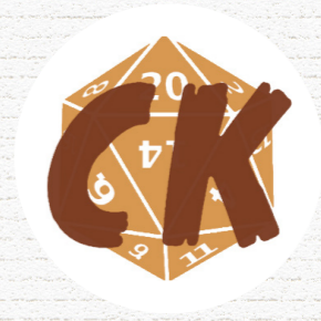
LES CÉRÉALES KILLERS Valenciennes