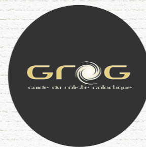
LE GROG Site internet