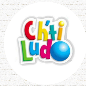
CH'TI LUDO Haubourdin