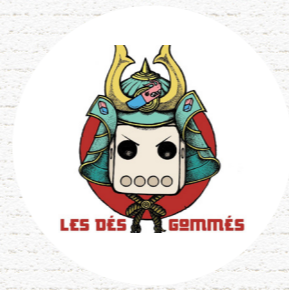
LES DÉs GOMMÉS Laventie