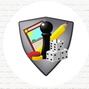
LA CONFRÉRIE DU JEU Allennes-les-Marais