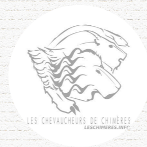
LES CHEVAUCHEURS DE CHIMÈRES Marquette-lez-Lille