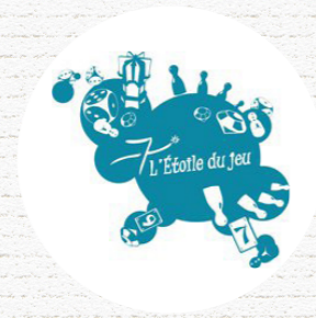
L'ÉTOILE DU JEU Mons en Baroeul