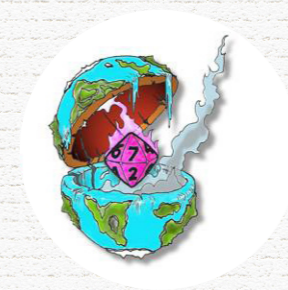
TERRA GEEKA Itinérante