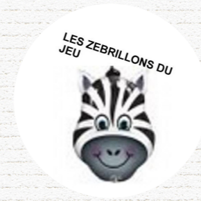
LES ZEBRILLONS DU JEU Mouvoux