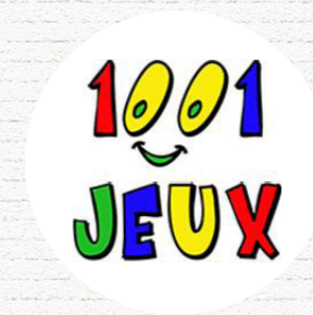
1001 JEUX Sainte