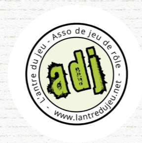
L'ANTRE DU JEU Villeneuve d'Ascq