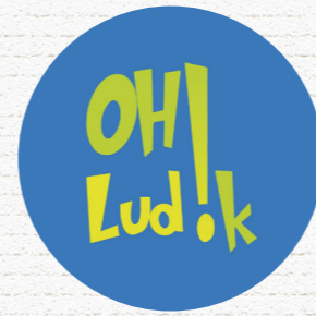
OH LUD!K Mouvoux